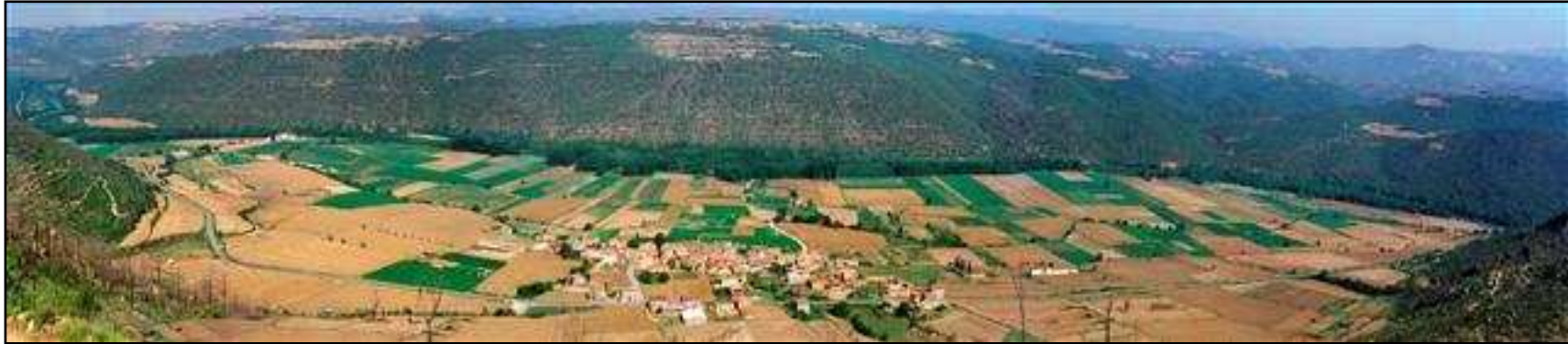
Vista general del poble de Tiurana anegat per les aigües del pantà