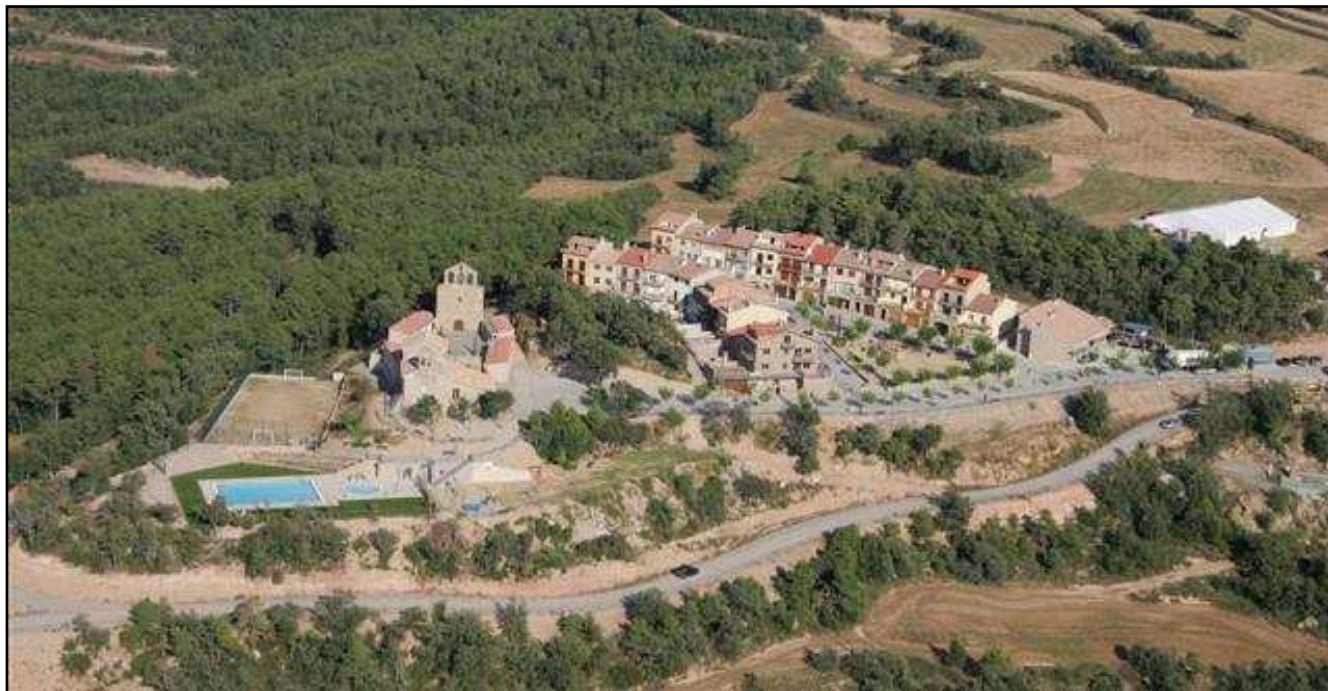
Vista general del ressorgir de Tiurana